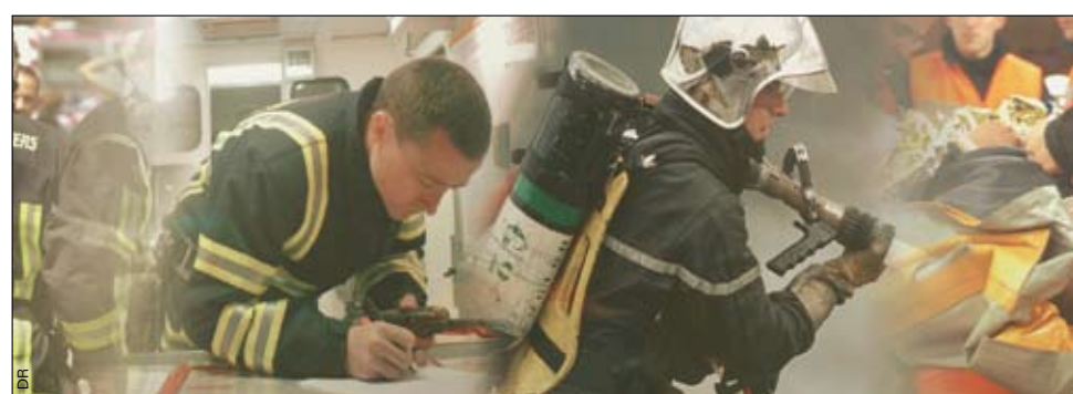
Chaque agent peut se former et construire son évolution de carrière.

L'offre de formation couvre les différentes étapes de la carrière d'un sapeur-pompier. Nous utilisons aussi bien des pédagogies traditionnelles que l'enseignement à distance. L'une des préparations de concours qui rassemble le plus d'effectifs est celle de lieutenant de sapeur-pompier professionnel, entièrement organisée autour de la formation à distance. Elle permet annuellement à environ 600 stagiaires de se préparer aux épreuves. Dans le domaine de la formation continue d'autres actions proposent aux sapeurs-pompiers d'acquérir les unités de valeur qui contribuent à améliorer leurs connaissances. Enfin, nous aidons les services départementaux d'incendie à mettre en place des enseignements dans le domaine des interventions en situations délicates (risques chimiques et divers).